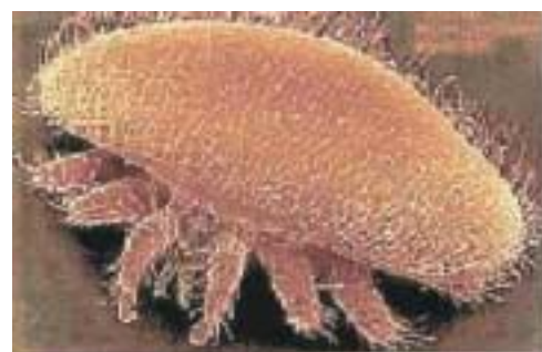
IMMAGINE AL MICROSCOPIO