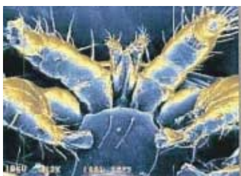
PARTICOLARE DELL' APPARATO BOCCALE