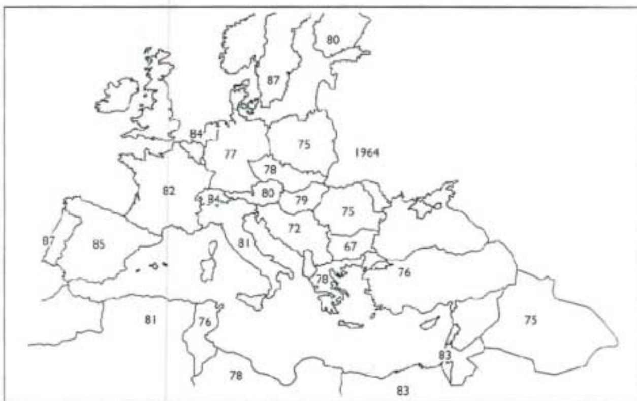
Distribuzione geografica e anno d'introduzione della varroa in Europa e nei paesi del bacino mediterraneo.