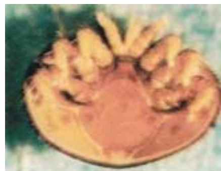
VISIONE DORSALE E VENTRALE