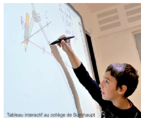
Tableau interactif au collège de Bunnhaupt